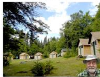
Ze života českých a slovenských emigrantů v okolí Montrealu