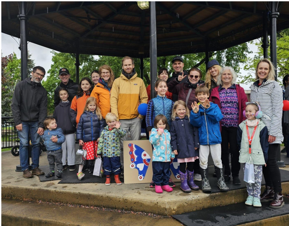
Fotografie účastníků pikniku České školy Montreal

mimo jiné ukázali, jak se učí čeština venku a jak na to; jak vytvořit smysluplnou hodinu; jak použít knihy a obrázky ve výuce češtiny a představili nám virtuální universitu třetího věku. Počasí v Bostonu bylo opět velmi deštivé a město jsme si prohlédli v chladu a bez sluníčka. Příští konference proběhne v Czech Museum ve městě Houston v Texasu.