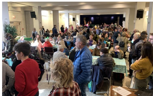
Na fotkách Richarda Cekala hala kostela sv. Moniky před zahájením bazaru a pak plná lidí během bazaru.