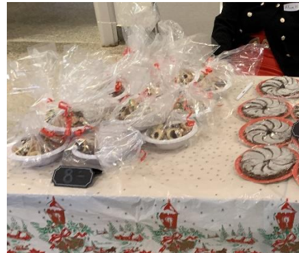
Na fotkách Richarda Cékala stůl s rakvičkami, příprava obložených chlebičků a stůl s balíčky vánočního cukroví.